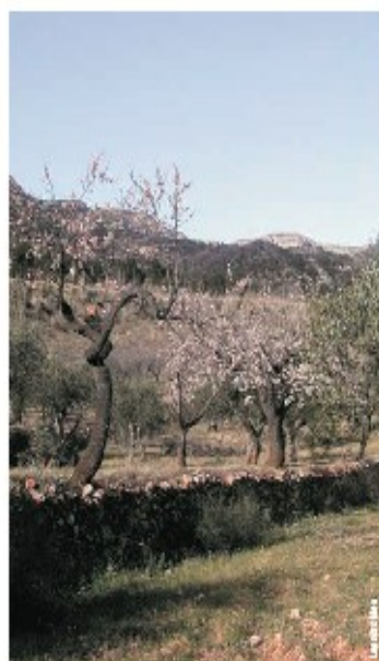
Cultivos y vista del Montcabrer, Muro d'Alcoi

comarca: el Comtat recorrido: 12,5 km tiempo: 6 h dificultad: media cartografía: 1:50.000 Oninyent 820 (28-32) - Alcoy 821 (29-32) entidad promotora: C. Excursionista de Muro